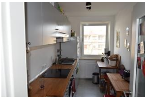
Küche (ohne Einrichtung !)