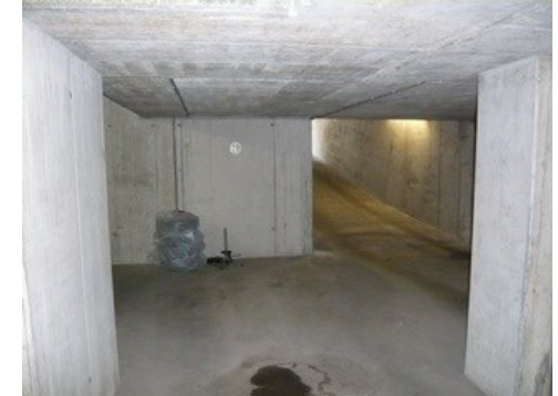
Im Uhrzeigersinn: Bad / Schlafzi. / Gästezimmer mit Empore / TG / Waschküche / Schlafzi.