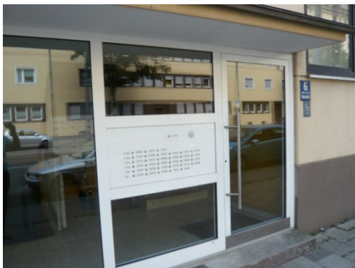
Im Uhrzeigersinn von links oben: