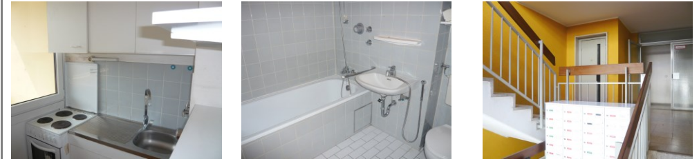
Von links nach rechts: Küche / Bad / Treppenhaus

Stand der Informationen in diesem Exposé: 17. Juli 2015