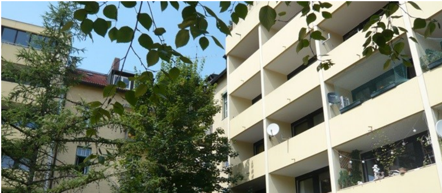
Im Uhrzeigersinn von links oben: Blick vom Balkon / Wohnzimmer / Schlafzimmer / Innenhofansicht