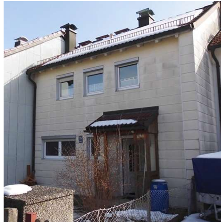
Im Uhrzeigersinn von links oben: Wohnzimmer / Überdachte Terrasse / Garten / Eingangsseite / Gartenansicht